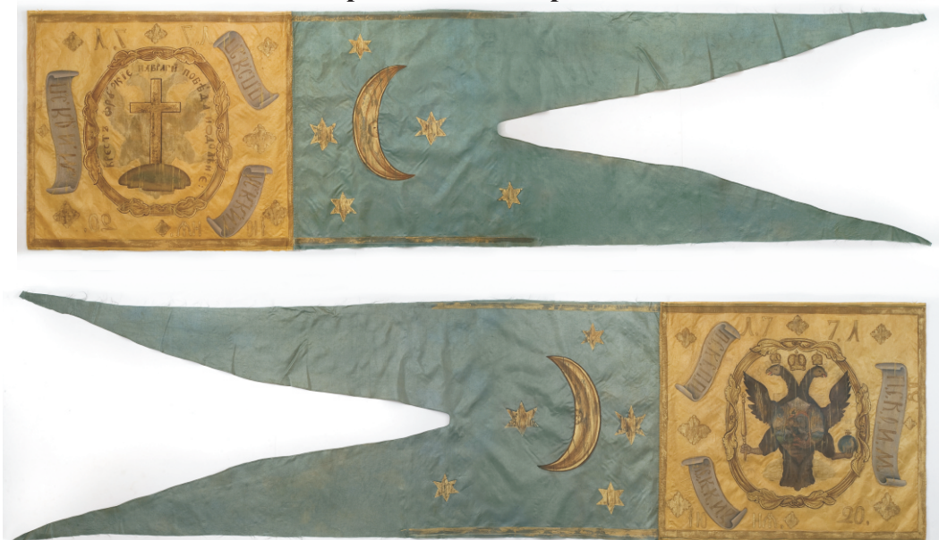
Значки Войска Запорожского Низового 1770-х гг., поступившие в конце XVIII в. с бывшими запорожскими старшинами в Черноморское казачье войско и хранившиеся с сер. XIX в. в числе кубанских войсковых регалий:

К статье А. Чернышова «Запорожское наследие»