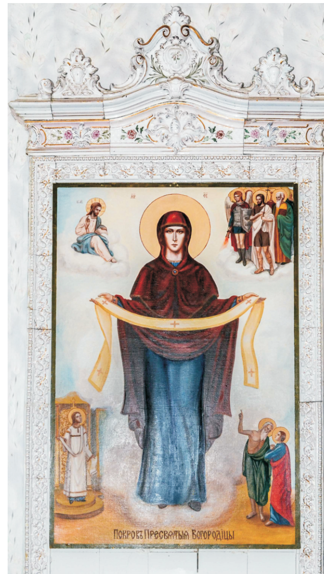
Зеркало изразцовой печи в доме купца З.Ф. Щербака. Нач. XX в. Краснодарский край, г. Новокубанск, КубНИИТИМ.