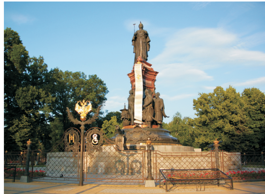
Памятник Екатерине Великой.