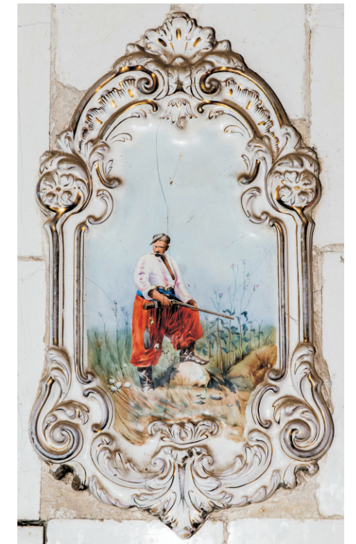
Изразец-панно печи в здании станичного правления. Нач. XX в. Краснодарский край, ст-ца Вознесенская. Фото Д.И. Гангур, 2015