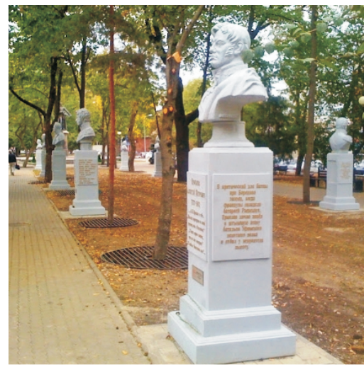
Аллея славы в Маринском сквере.