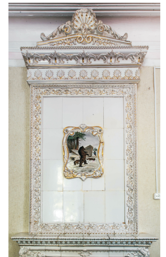
Изразцовая печь в купеческом доме. Фрагмент. Нач. XX в. Краснодарский край, г. Лабинск.