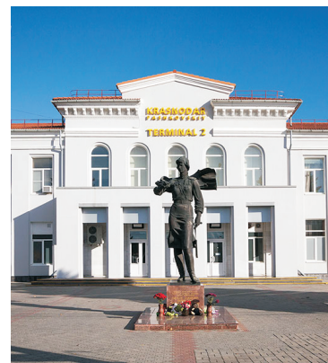
Памятник Евдокии Бершанской.