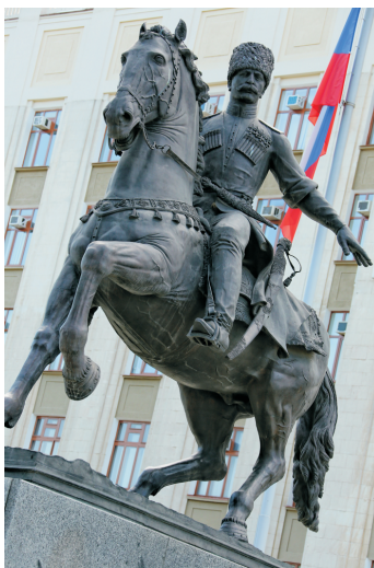
Памятник казакам.