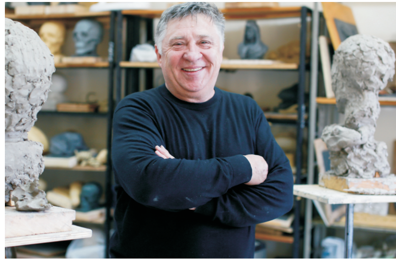
Скульптор А. Аполлонов.