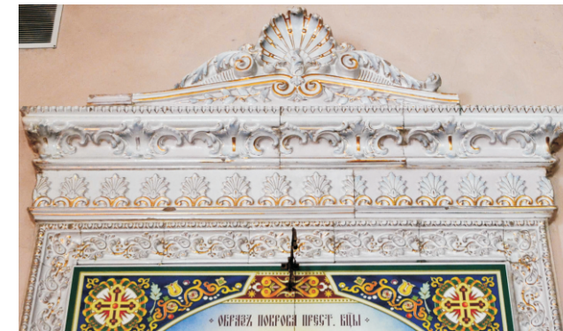
Изразцовая печь в доме купца З.Ф. Щербака. Фр. Витебский изразцово-майоликовый завод Б.Я. Лисовского. Нач. XX в. Краснодарский край, г. Новокубанск, КубНИИТИМ.