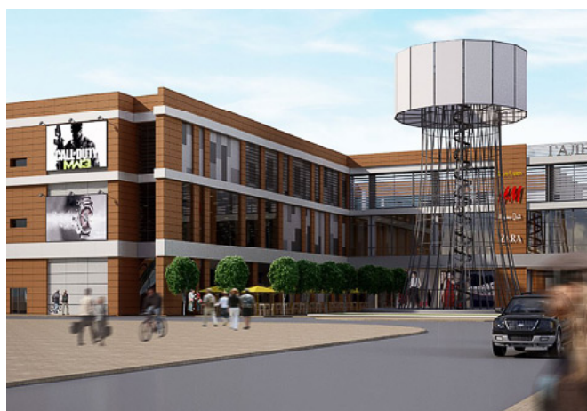
Рисунок 3. Башня Шухова в Краснодаре

Основным звеном ребрендинга Краснодара должно быть продвижение урбанистического кластера, или развитие города как социокультурной системы, развитие города как увеличение социального и культурного капитала его жителей, что означает превращение горожанина в актора «умной деятельности» (smartactivity) [6]. Над продвинутым образом города, его моделью надо работать и формировать посредством культурных программ, акций, мероприятий. Вероятно, неплохим символом инновационного тренда в Краснодаре могла быть башня инженера В.Г. Шухова (рисунок 3), однако она находится рядом с торговым центром, а к идее инновационного района Краснодар еще не пришел. Вступление в инновационный тренд Smart City обозначено с помощью федерального проекта, но еще не стало имманентным свойством жизни мегаполиса.