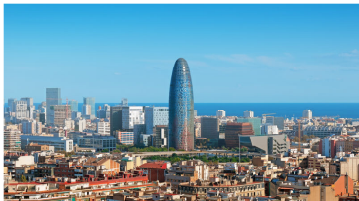
Рисунок 1. Район 22@ в Барселоне

Квартал 22@ (рисунок 1) изменил свое лицо за последние десять лет. В этот временной период здесь построено множество новых сооружений. Прежние здания, основой которых были заводы и фабрики, либо полностью уничтожены, либо подвергнуты глобальной модернизации. Например, в здании старой прядильной фабрики XVIII века размещен фонд современного каталонского искусства (живописи), а в парке Клот трубы фабрики и полуразрушенные стены являются элементом садового ансамбля. С двухтысячных годов в новопостроенные здания перебрались около 4500 предприятий, а жителей района увеличилось за десять лет на 23 %. Власти города заботятся и об озеленении, благодаря чему появляется природная и архитектурная достопримечательность.