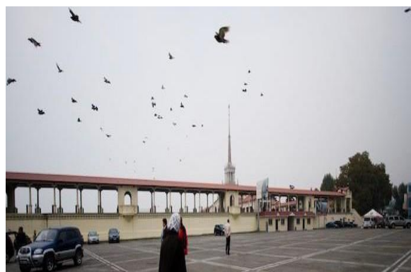
Рис. 1. «Аркадия» продолжит дизайн здания морского вокзала.