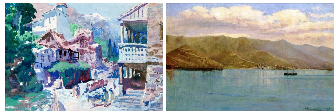
Крутько П.Я. Крымский вид. 1930-е. б./акварель