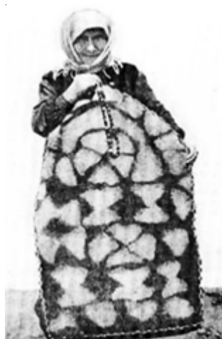
Рис. 1. Карачаевка с намазлыком. Мастерица Х. Тхахова. Публикуется по [10]

На представленной реконструкции карачаевского намазлыка (рисунок 2) изображена только доисламская, языческая, символика – треугольники «дуа» в различных вариациях (по одному, по два, по четыре, по пять), поэтому возможно предположить, что этот коврик относится к более раннему периоду исламизации.