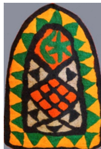
Рис. 3. Балкарский намазлык. Мастерица Х. Курданова. 2 половина XX века.