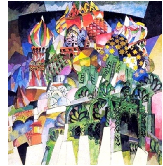
Собор Василия Блаженного (1913 г.)