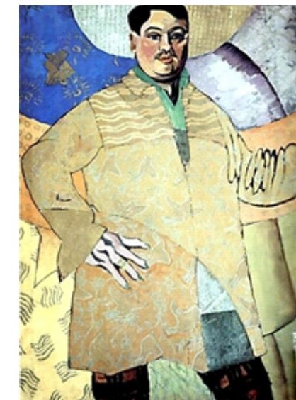
Великий художник (автопортрет) (1915 г.)