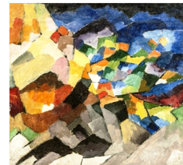
Пейзаж. Скалы (1913 г.)