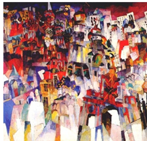
Москва (1913 г.)