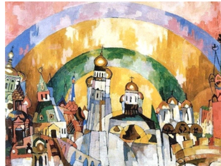
Небосвод (1915 г.)