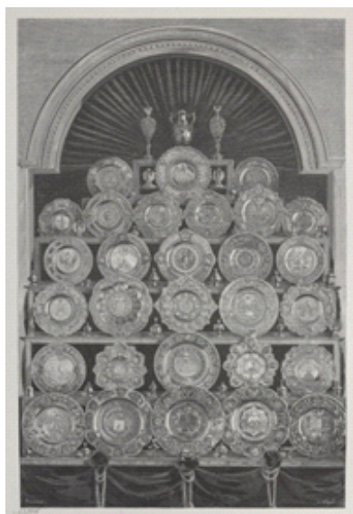
Рис. 3. Л. П. П. Дюмон по рисунку Фримэна. Изображение группы серебряных блюд и солонки, поднесенных Александру II губернскими представителями во время коронации. 1856. Издание: Description du Sacre et du Couronnement de leurs Majestés Impériales l'Empereur Alexandre II et l'Impératrice Marie Alexandrovna. [Б.м.] : [б. и.], 1856. Ксилография на китайской бумаге. 47х32 см. Инв. № Э5РГ-2784