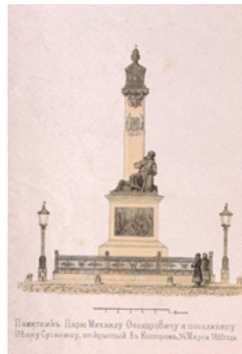
Рис. 2. В. Ф. Тимм по собственному оригиналу. Памятник царю Михаилу Федоровичу и Ивану Сусанину, открытый в Костроме 14 марта 1851. Санкт-Петербург. 1851. Литографская мастерская А.Э. Мюнстера. Издание: Русский Художественный листок В. Тимма. 1851. № 14. Бумага; литография с тоном. 36.3х54.3 см (размер листа). © Государственный Эрмитаж, Санкт-Петербург. Инв. № ЭРГ-3960 (фрагмент)