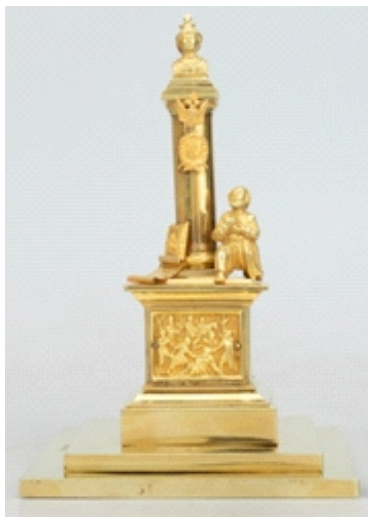
Рис. 1. Подносная солонка. Россия, Кострома. 1856. Серебро, позолота; чеканка. 21,4х14,5х14,5 см. Инв. № ЭРО-5399