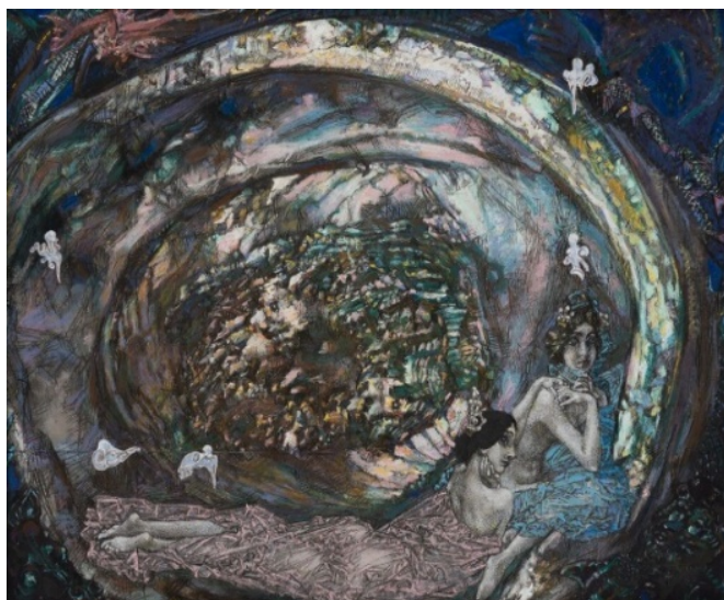
Рис. 3. Врубель М.А. Жемчужина (1904)

пастели к бумаге, спокойный цветотональный колорит (рис. 4).