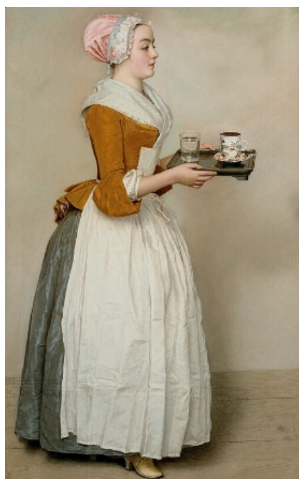
Рис 2. Лиотар Ж.-Э. Шоколадница (ок. 1743–1745)

В конце XIX века художники в своих работах обращались к экспериментам с техникой пастели. Например, Л.О. Пастернак соединял пастель и темперные краски; В.Э. Борисов-Мусатов в своем творчестве использовал пастель и масло, темперу, акварель, гуашь. Картина В.Э. Борисова-Мусатова (1870–1905) «Дама в голубом» написана в смешанной технике: акварель подчеркнута, доработана пастелью, что создает впечатление звучащей музыки, благодаря тонкому изображению хрупкой поэтичной модели. На работах В.Э. Борисова-Мусатова вначале прописан тонкий деликатный подмалевок акварели, поверх него нанесена чуть более плотная тональная штриховка пастели, которая уточняет и моделирует форму элементов композиции.