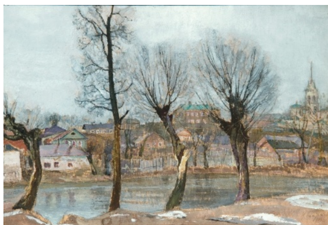
Рис. 6. Бродский И.И. Псков. Ветлы (1913)

Произведения А.Я. Головина (1863–1930) отличались высоким живописным мастерством и оригинальной техникой работы: в основном он работал клеевыми красками, гуашью, темперой и пастелью (рис. 7). Художник использовал бумагу с шероховатой поверхностью, особым образом обработанную, или писал на загрунтованном холсте, покрытом тонким слоем клеемелового грунта (проклейкой, состоящей из мела и раствора столярного клея). Заключительную моделировку цветом, после основной живописи, он выполнял пастельными карандашами по свежей темпере, нанося мягкие штрихи, или втирая пастель пальцем. Интересен технический прием А.Я. Головина: на холсте он смешивал клеевую краску для выполнения театральных декораций, темперу, гуашь, и в эти влажные краски он втирал пастель.