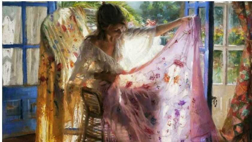
Рис. 8. Ромеро В. Женщина, сидящая на кресле с розовым платьем (2020)

Художник Антонио Абад (1953 г.р.) часто использует для работы яркую цветную основу (рис. 9). А. Абад работает на картоне для пастели с абразивным нанесением, что придает его произведениям контрастность графических выражений, яркость и звучность завершенной работы [10. С. 33].