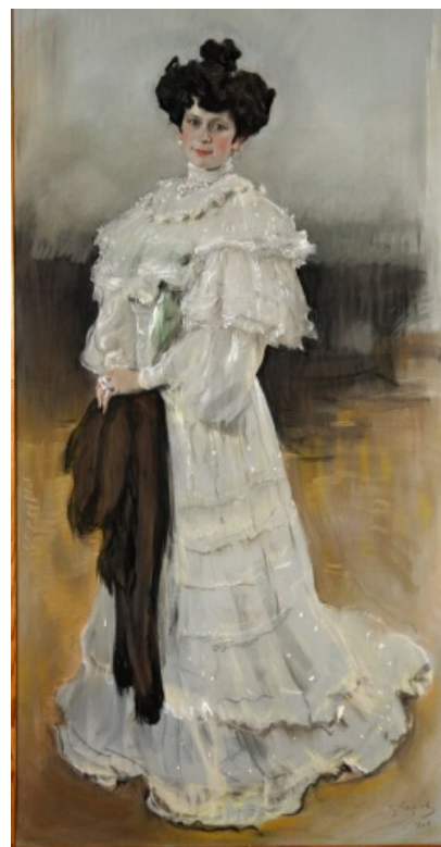
Рис. 4. Серов В.А. Портрет Е.А. Красильщиковой (1906)

В конце XIX – начале XX вв. многие художники России также работали в технике пастели. Манера рисования была различной, использовались определенные выбранные приемы, с учетом специфики материала, его состава и изготовления. Художники объединения «Мир искусства» – М.В. Добужинский, К.А. Сомов, Л.С. Бакст, Н.С. Гончарова, З.Е. Серебрякова, А.Н. Бенуа – обладали индивидуальным почерком и манерой исполнения, их работы полны изящества и артистизма, построены