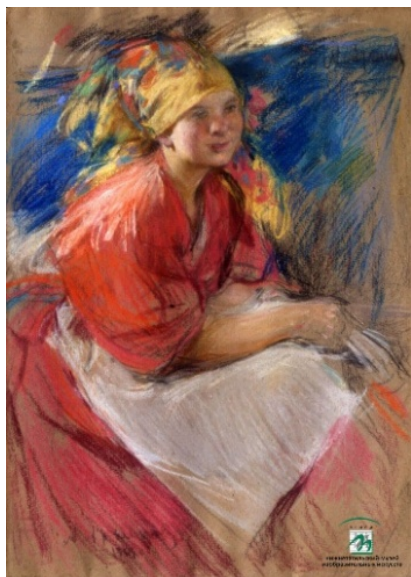
Рис. 5. Архипов А.Е. Крестьянка (1909)

Техника пастели переживала как периоды спада, так и подъема; наиболее заметное оживление и интерес к данному материалу происходит во второй половине XX века. Например, А.Е. Архипов (1862–1930) чаще всего писал маслом, но в последние годы своей жизни обращался к пастели, используя серый плотный картон с шероховатой фактурной поверхностью. Его техника работы пастелью сходна с его техникой живописи маслом – такая же широкая манера письма, в которой звучала рельефность в передаче формы (рис. 5).