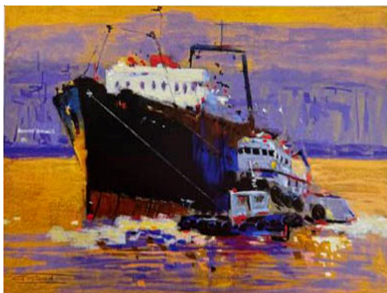
Рис. 9. Абад А. Курс на пристань (2020)

Отличительной чертой живописных работ китайского художника Линг Ли является сочетание больших цветотональных отношений с организацией предварительного подмалевка (рис. 10) 1 [10. С. 78].